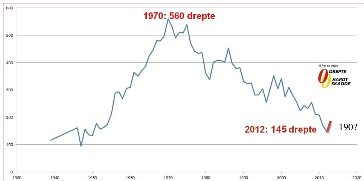
Trafikkdrepte i Norge 1940-2013

Men 2013 blir et statistisk tilbakeskritt. Det er dessverre langt flere trafikkdrepte i Norge i 2013 enn i 2012. Endelige tall er ikke klare på en stund, men det kan bli ca. 190 trafikkdrepte i 2013. Lignende brudd i den positive utviklingen har det vært ca.15 ganger tidligere også, noe statistikken «Trafikkdrepte i Norge 1940-2013» under viser. Antallet drepte i 2013 er likevel det tredje laveste siden 1950.